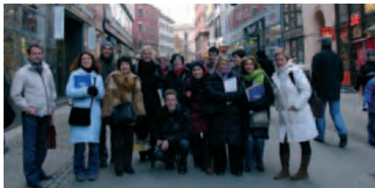
Účastníci stáže Academia v Brně

Stáž začala v pondělí, kdy nám byl představen vzdělávací systém České republiky.