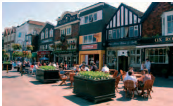
Salisbury – město, ve kterém jsem 8 měsíců pracovala běžně uvidíte maminky ve světlíku a lodičkách bez ponožek tlačící kočárek s dítětem v sandálkách.

Na letišti v Birminghamu se několik z nás instinktivně poznalo, vytvořili jsme hlouček a čekali, co se bude dít dál. O tom, kdy, kde, kdo a jak nás vyzvedne, jsme nikdo neměl ani tušení. Asi po půl hodině k nám přicupitala slušně vypadající paní s trochu obézním pánem. Aniž by se nám představila, začala si nás odskrtávat na svém seznamu. Poté, co zjistila, že jsme všichni zdárně dorazili a nikdo z letadla nevyšel, nás naložili do dodávky a odvezli, nikdo nevěděl kam. Myslím, že nejenom já jsem si pomyslela, tak teď nás někde prodají a bude po „ptáčkách“. Naštěstí jsme se zanedlouho ocitli u jednoho hotelu v menším městečku Wolverhampton. Následovaly dva dny volna a pětidenní školení. Vůbec jsme neváhali a při první příležitosti vyrazili poznávat každý svým způsobem pro nás zatím neznámou zemi. Na počáteční dojmy z Anglie zřejmě nikdy nezapomenu. Při prvním přecházení silnice mě téměř porazilo auto, jelikož se zde samozřejmě musíte nejprve podívat doprava a ne doleva. Po čaji s mlékem a nechutné anglické kuchyni mi můj žaludek oznamoval, že to mám raději vyležet, ale to se mi moc nepodařilo. Na pokoji byla zima jak na Sibiři, tekla pouze vlažná voda a místo očekávané teplé peřiny jsem na posteli našla prostěradlo s tenkou příkrývkou. Druhý den mi bylo vše o trochu jasnější. Při procházce městem jsem si všimla, že to nebude asi jenom hotel, co se nás snaží otužovat, ale že jsou Angličané patrně otužili od přírody. Začátkem dubna tu prý nikdy nebývá moc vedro, ale