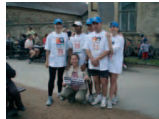
Tým kampaně na Tuháčkově běhu

Na konci dubna se konal veletrh neziskových organizací „NGO market 2006“. Proběhla prezentace kampaně v rámci veletrhu, kde se představily zejména NNO z oblasti lidských práv, vzdělávání, rozvoje multikulturní společnosti, participace, demokracie atd.