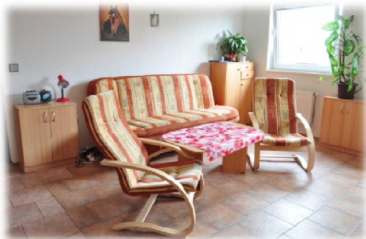
Chráněné bydlení v Brandýse n. L.

Lidé, kteří využívají sociální službu Chráněné bydlení Vyššího Hrádku, p.s.s., mají možnost vyzkoušet si zcela nový, pro ně doposud většinou neznámý způsob života. Namísto „ústavní péče“ se za podpory asistentů učí samostatně starat o vlastní domácnost, plánovat svůj volný čas a rozhodovat o veškerých záležitostech týkajících se jejich života.