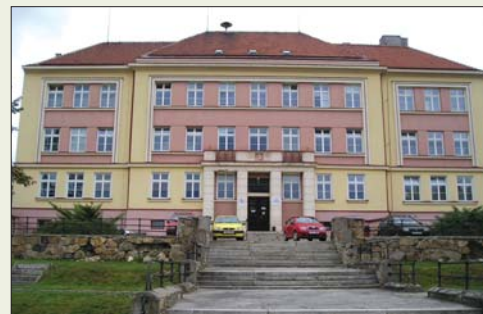
Domov důchodců Velké Meziříčí

„... standardy jsme začali zpracovávat koncem roku 2005 bez jakýchkoli předchozích zkušeností v této oblasti. Poznatky z workshopů jsem předávala našim sociálním pracovníkům,