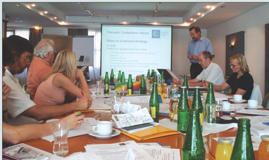
Projektový tým při jednání ve Vídni

I v ostatních zemích lze hovořit o dosažených výsledcích, tedy kromě Francie, která z projektu vzhledem k personálním změnám na Ministerstvu národního školství odstoupila. Např. v Německu bylo pro naplnění cíle projektu ustanoveno občanské sdružení s názvem Národní poradenské fórum, které má ambice stát se celostátní diskusní platformou. Polsko vstupovalo do projektu již s vytvořeným Národním poradenským fórem, které v průběhu řešení projektu změnilo svůj statut také na občanské sdružení s celostátní působností a úkoly na mezinárodní úrovni. V Rakousku byla při Ministerstvu školství, vědy a kultury zřízena pracovní skupina pro poradenství, která by se měla stát jádrem uvažovaného národního poradenského fóra.