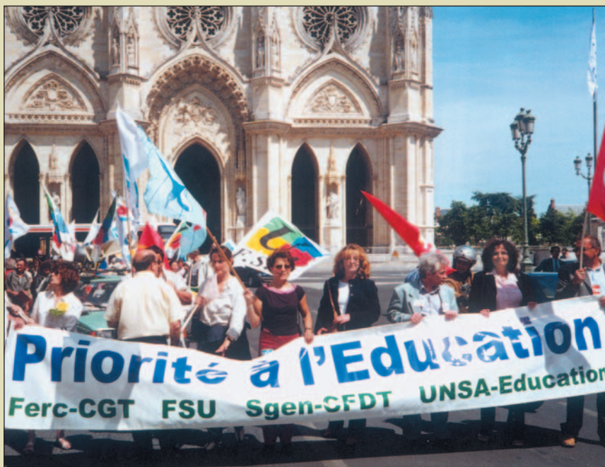
Národní vzdělávací fond nevynechá žádnou příležitost podpořit vzdělávání...

Informace, podklady pro zpracování přihlášky a úplný text Výzvy v české i anglické verzi: www.nvf.cz/leonardo , tel.: 224 500 522, mail: leonardo@nvf.cz