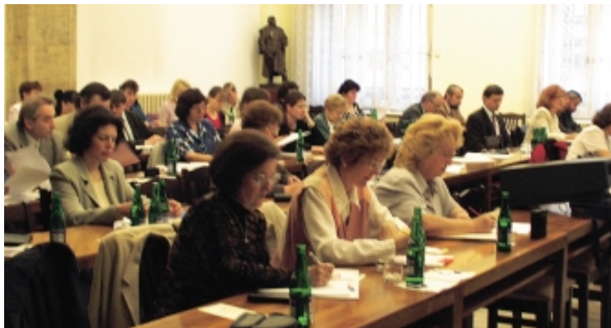
Účastníci valorizačních seminářů soustředěně sledovali prezentace výsledků projektů programu Leonardo da Vinci. Snímky jsou ze druhého a třetího valorizačního semináře.

dem ke svému tématu se uskutečnil v rámci Evropského roku jazyků. Sérii seminářů uzavřel červnový seminář na téma Přínos nadnárodní spolupráce škol a podniků ke zlepšování relevance odborného vzdělávání.