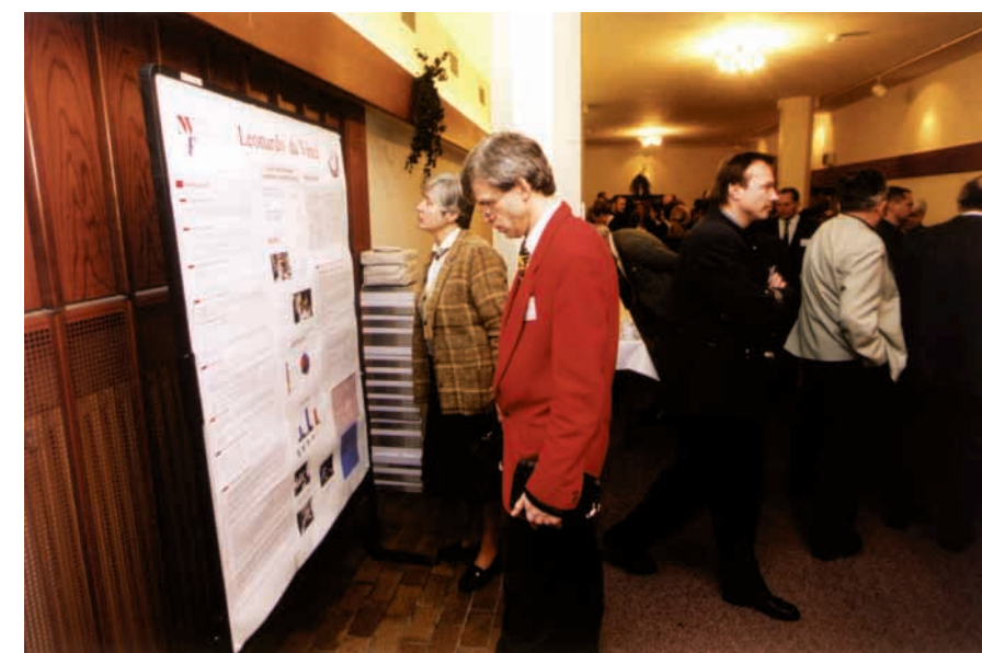
Konference Leonardo da Vinci