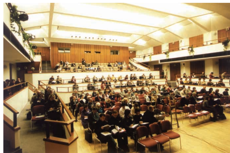
Konference Leonardo da Vinci

Na začátku března uspořádala Národní agentura programu Leonardo da Vinci, která je součástí Národního vzdělávacího fondu, v Praze dvoudenní konferenci Evropský program na podporu odborného vzdělávání Leonardo da Vinci v České republice .