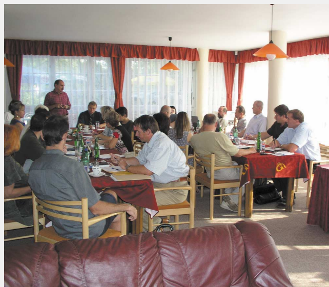
Porada vedoucích odborů školství krajských úřadů, na níž se jednalo mj. o projektech mobility programu Leonardo da Vinci.

The Mobility Projects (placements and exchanges projects) are the most successful projects in the Czech Republic's Leonardo da Vinci Programme. So far, over 5000 young people have