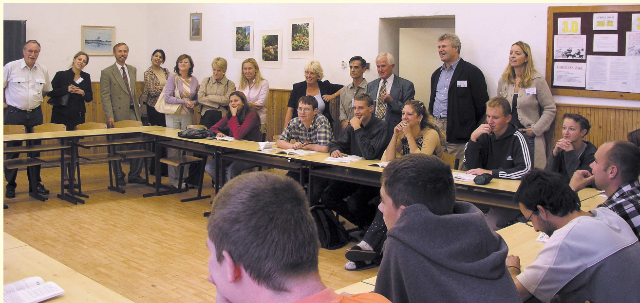
Účastníci studijní cesty CEDEFOP na SOU v Horkách nad Jizerou / Participants of the CEDEFOP study visit to the Vocational School in Horky-upon-Jizera

All project proposals have met the eligibility criteria. After a check of formal requirements the National Agency organised a seminar for external experts who will assess the project proposals. Each project proposal is assessed by two independent external assessors, the next assessment is conducted by the National Agency. After the assessment procedure is finished, about half of the promoters will be invited to submit their final proposals. The deadline for this is 13 February 2004.