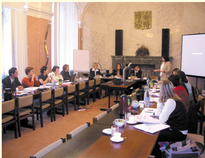
Členové pracovní skupiny č. 3 tematického monitorování na poradě v Praze Meeting of Thematic Monitoring Group 3

3. říjen 2003 byl v programu Leonardo da Vinci termínem pro předložení předběžných návrhů projektů spadajících do tzv. procedury B. Jsou to rozsáhlejší projekty, jejichž cílem je vypracovat inovativní vzdělávací materiály zlepšující odborné vzdělávání určitých cílových skupin osob v různých sektorech. Národní agentura programu k tomuto datu obdržela celkem 37 předběžných návrhů projektů, které již představují generaci projektů 2004. Je to o 4 více než v loňském roce. Z předložených 37