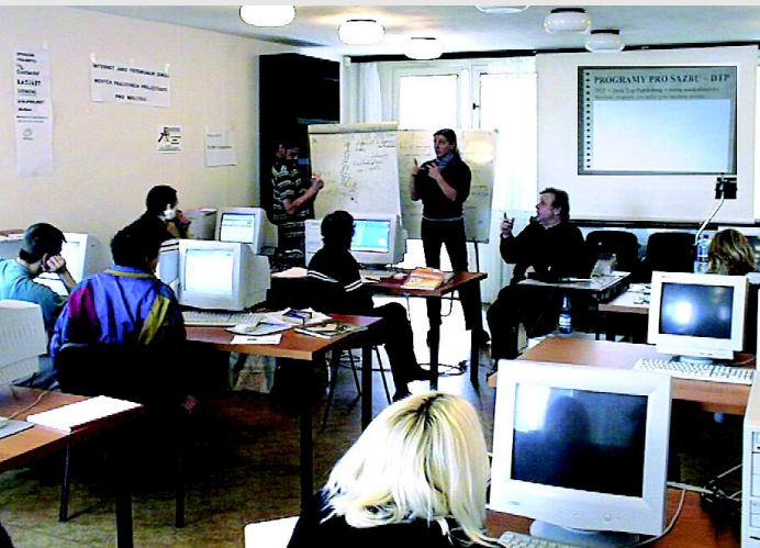
Z ověřování vyvíjených vzdělávacích materiálů

Slepotu odděluje člověka od věcí, hluchota od lidí. (slepopluchá Američanka Helena Kellerová)