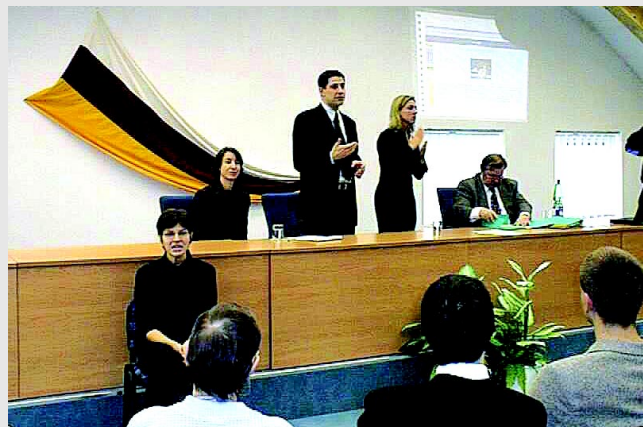
Projekt ocenil na tiskové konferenci i ministr informatiky Vladimír Mlynář