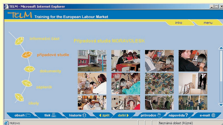
Ukázky informační části a případových studií z kurzu internetu.