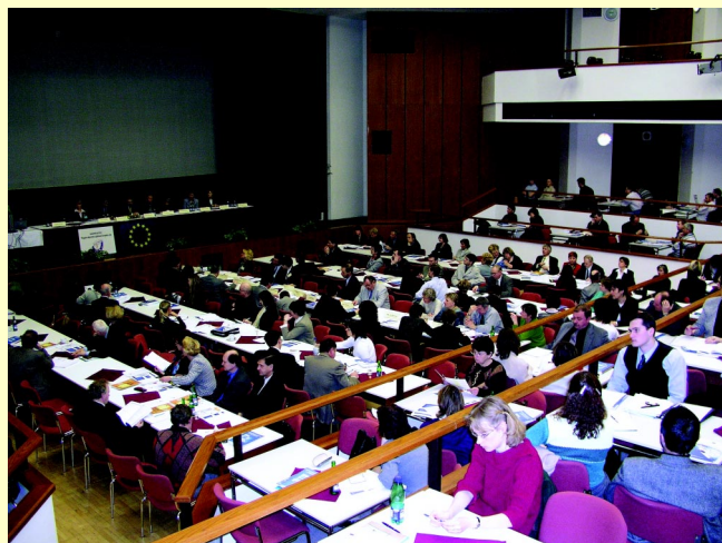
Konference se zúčastnilo na 250 účastníků.

V závěru účastníci konstatovali, že konference pomohla ukázat přínosy projektů mobility programu Leonardo da Vinci, že oceňování nejlepších projektů pečeti kvality přispívá ke zvýšení účinků a prestiže projektů mobility a že tyto projekty jsou vhodnou přípravou vzdělávacích institucí, vzdělávaných i vzdělavatelů na odborné vzdělávání v rozšířené Evropě. Doporučili, aby relevantní pracoviště na národní, regionální i lokální úrovni usilovala o začleňování dalších organizací do projektů mobility a o podporu těchto projektů.